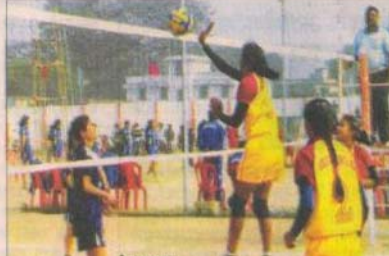
मैच का दृश्य

उधर, बालिका वर्ग में गत चैंपियन गुजरात के अलावे पश्चिम बंगाल, हरियाणा, केरल की टीमों अपने-अपने पुल में टीए पर रह कर क्वार्टर फाइनल में अपना स्थान सुनिश्चित कर लिया। इसके अलावे साई की टीम का भी