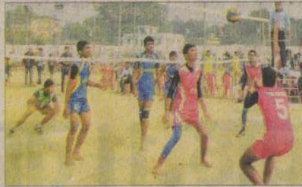
उत्तरप्रदेश व महाराष्ट्र बालक टीम के बीच मैच का दृश्य