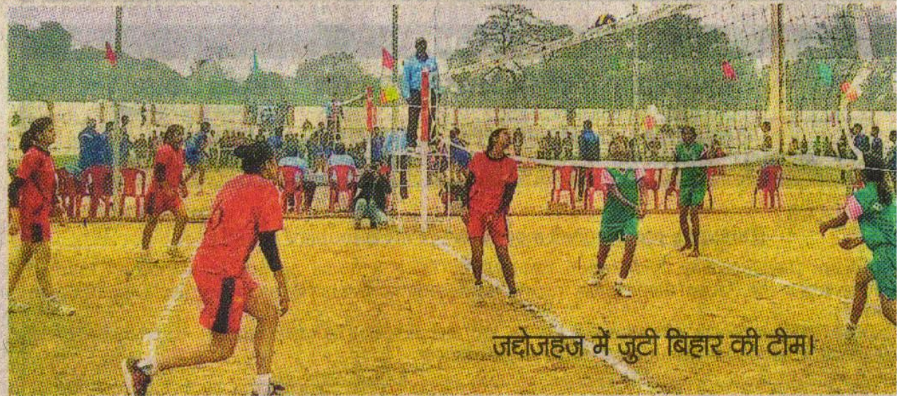
जदोजहज में जुटी बिहार की टीम।

अन्य परिणाम : बालक वर्ग में तमिलनाडु ने उत्तराखंड को 3-0, केरल ने तेलंगाना को 3-0, तेलंगाना ने असम को 3-0, महाराष्ट्र ने यूपी को 3-1, हरियाणा ने पुडुचेरी को 3-0, राजस्थान ने