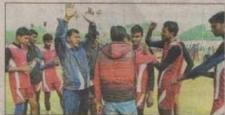
अपने खिलाड़ियों को शांत बनाने के तरीके बताते उतर प्रदेश टीम का कोच।