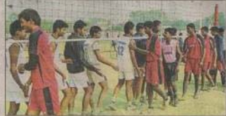
मैच शुरू होने के पहले प्रतियोगिता टीम के खिलाड़ियों से हाथ मिलाते खिलाड़ी।