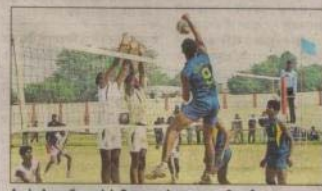
मैच के दौरान वॉल्ट बनने के लिए उछल करार का पुरुष खिलाड़ी।