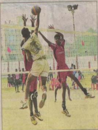
उत्तराखंड के खिलाड़ी के स्मश को रोकने के प्रयास में तेलंगना के खिलाड़ी।