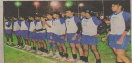
राज्य स्टैंडियम में मैच के पूर्व आउट लाइन पर खड़ी परिचय बंगाल की बालिका टीम।

मुकुन्दपुर की बालिका व बालक वर्ग के कई अहम मुकाबले खेले गये। बालक वर्ग में उत्तरप्रदेश के खिलाड़ी अपने दबदबा बनाते हुए हैं। खेलभूमियों की कई रोमांचक मुकाबले देखने को मिले। हालांकि लीग मैच का अंतिम दिन होने के कारण कई टीमों का पता भी चैंपियनशिप से कट गया। रविवार को क्वार्टर फाइनल के मुकाबले खेले