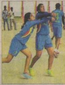
अभ्यास करती कर्णाटक की बालिका टीम