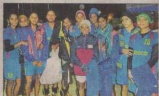
गुजरात की रात मैच जीतने के बाद कप्तान रितेश्वर होवर खड़ी खिल्ला खिलाड़ी।