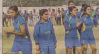
मैच के दौरान वॉल्ट बनने पर ताली बजा अपनी टीम का होमलाइट बहारों खिलाड़ी।