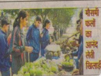
पौरसमी फलों का आनंद लेती खिलाड़ी