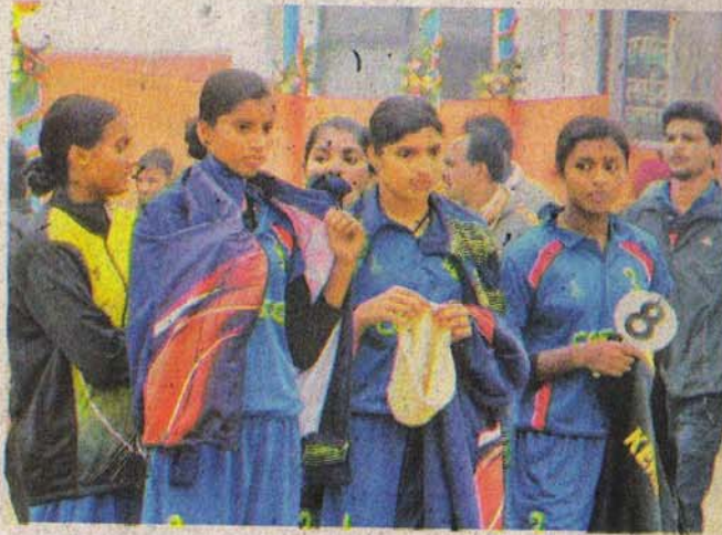
स्टेडियम में मौजूद खिलाड़ी