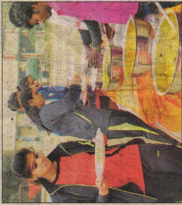
रामजयपाल कॉलेज में भोजन करती महिला टीम की खिलाड़ी

वालीबाल चैम्पियनशिप पर पड़ रही है मौसम की मार : वालीबाल चैम्पियनशिप में मौसम की भी मार पड़ रही है। अचानक ठंड बढ़ने से कई राज्यों की टीम को मैच खेलने में परेशानी हो रही है। उदघाटन के दिन विलंब होने से कई टीम ने खेलने से भी इंकार कर दिया था। ओस गिरने से पिच गिला हो जा रहा है। वहीं हवा चलने से गुजरात, महाराष्ट्र आंध्रप्रदेश के खिलाड़ियों को परेशानी हो रही है। वैसे अचानक ठंड बढ़ने से उत्तर प्रदेश, बिहार, मध्य प्रदेश, झारखंड, छत्तीसगढ़ व उड़ीसा समेत कई राज्यों को परेशानी का सामना करना पड़ रहा है। शाम के बाद तेज हवा चलने से मैच पर इसका प्रभाव पड़ रहा है। जिसके कारण खिलाड़ियों को हिट मारने में दिक्कत हो रही है।