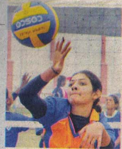
बाल को हिट करती महिला खिलाड़ी

42वीं जूनियर नेशनल बालीबाल चैम्पियनशिप के दूसरे दिन भी दोनों वर्गों में गुजरात एवं साई की टीम ने अपना दबदबा बनाये रखा। वहीं मेजबान टीम ने साई से हारने के बाद आज त्रिपुरा के 3-0 से रहा कर जीत का स्वाद चखा। आज के मैच में टीम पूरे जी जान लगाकर खेल रही थी। लेकिन गुजरात व साई की टीम अपने प्रतिद्वंदी को आराम से पटखनी दे रहे थे। वहीं उत्तर प्रदेश की टीम भी जीत के लिए पूरे दमखम से मैदान पर डटे थे। जूनियर वालीबाल आयोजन समिति के प्रवक्ता सुनील कुमार सिंह ने बताया कि आज बालक-बालिका का करीब 22 मैच हुआ।