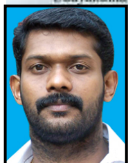
K.J. Kapil Dev (2010)