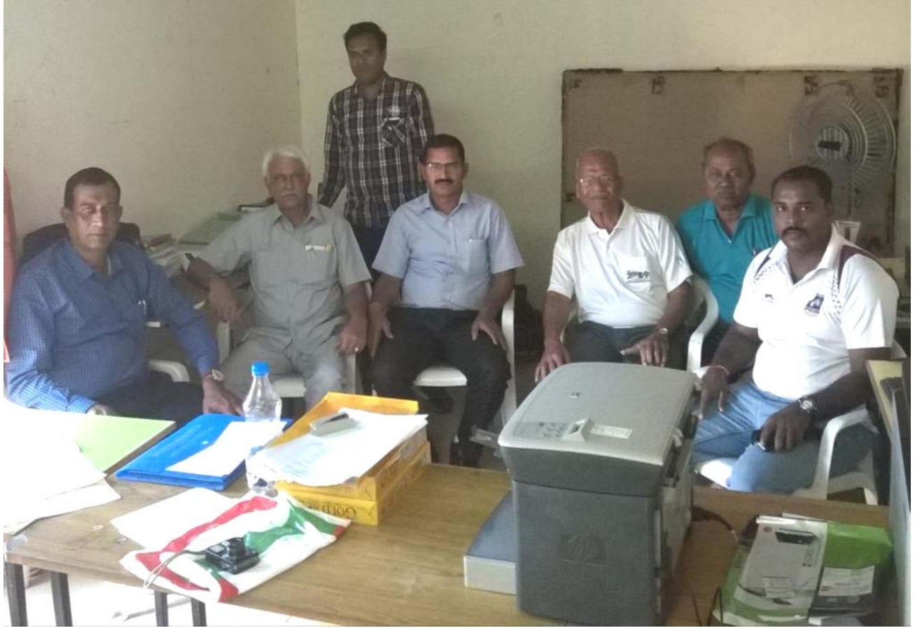
Members of the Control Committee & VFI office