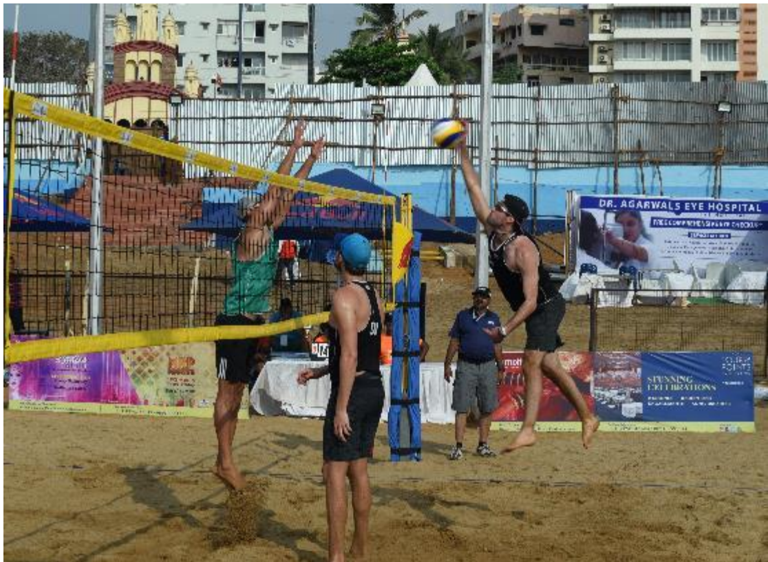
An action moment between match Canada and South Africa Men teams