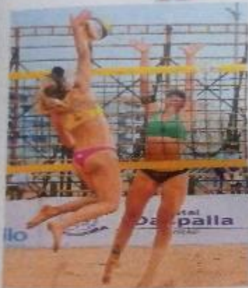
తలవదుతున్న అమెరికా - ఆస్ట్రేలియా క్రీడాకారిణులు