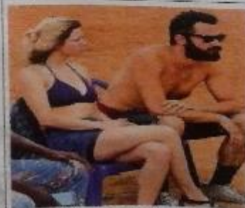
పోటీలను పీకేస్తున్న దృశ్యం

బీచ్ వాలీబాల్ పోటీలు రోజురోజుకీ మరింత ఆకర్షణగా తయారవుతున్నాయి. ఇటు కుహివా ఇట్టు.. అటు పురుష ఇట్టు తమ ప్రత్యర్థులను బోల్తా కొట్టించడానికి ఎన్నోకు సైలెంట్లు వేస్తూనే ఉన్నారు. ఇసుకలో అలవోకగా కదులుతూ.. తమ శరీరాలను నిల్బుల్లా వంచుతూ.. బంపిస్తే నియంత్రణ సాధిస్తూ.. పాయింట్లను సాధిస్తున్నారు.