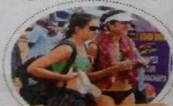
వివాదరూం అడుగు కలగినవై...