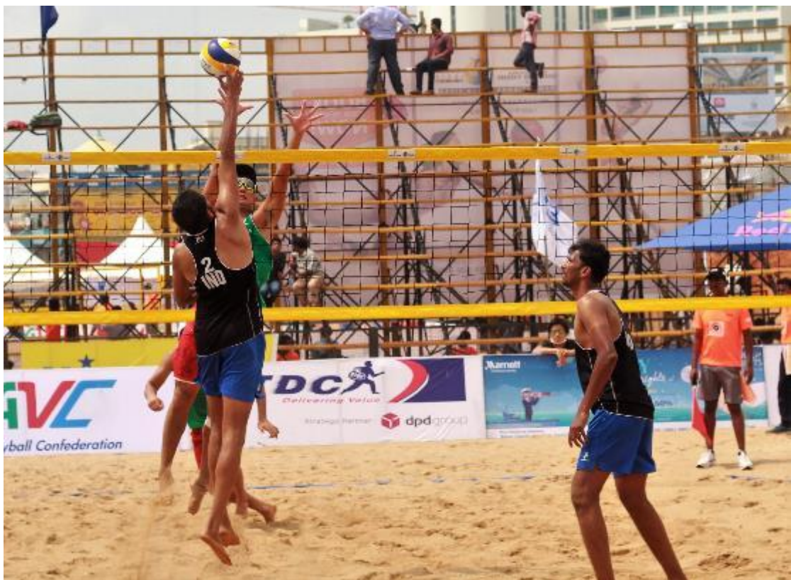
An action moment between match India and Japan Men teams